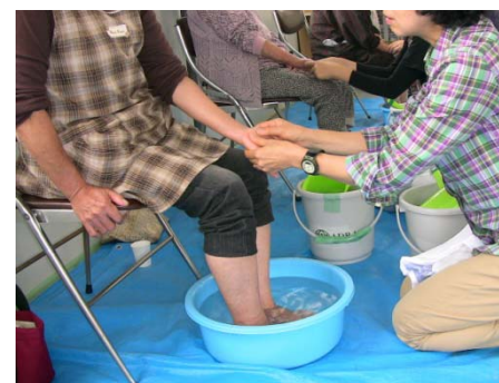
ボランティアによる足湯