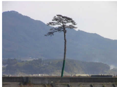
「希望の一本松」、対岸より臨む(下)

最終日に訪れた岩手県陸前高田市は、太平洋岸に面し、今回の大津波で中心部は壊滅的な被害を受けました。海岸沿いには、江戸時代以来の防潮林で、美しい景勝地の高田松原がありました。7万本もあった松林は大津波で壊滅し、たった一本の松だけが奇跡的に生き残り、地元の人たちが復興のシンボルとして「希望の一本松」 ii と呼んでいます。