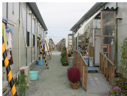
亶理町応急仮設住宅(上)と案内図(下)

「震災直後から避難所で被災者の食事づくりをしていたの。500人分の食事を作るから、そりゃ大変だよ。私も家は全部だめになっちゃって、避難所に